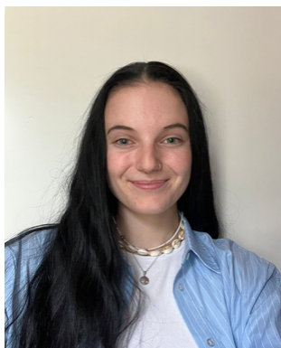
Communication : Eva Choppard

Naïs est également joueuse de bandy depuis la création de l'équipe suisse féminine et joueuse de hockey au Lausanne hockey club.